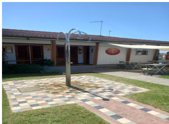
doccia all'aperto esterna